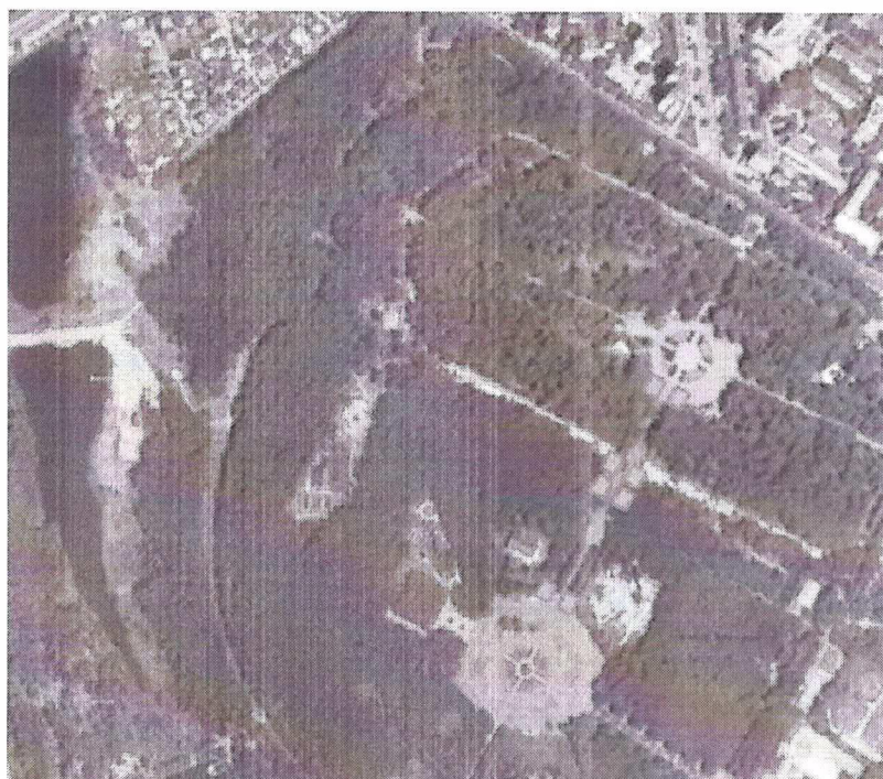
Места установки нестационарных торговых объектов на территории Центрального парка культур и отдыха им. П. П. Беллусова